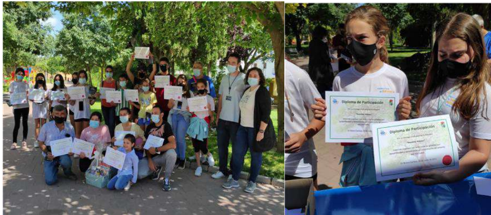
PARTICIPACIÓN DEL CONSEJO LOCAL DE INFANCIA Y ADOLESCENCIA EN LA GINKANA FAMILIAR "NUESTROS ÁRBOLES". 2021.

18.- Nuevas Tecnologías de la Información y la Comunicación (TICS). A través del Centro Guadalinfo principalmente, se acercan las TICS a toda la población de la localidad, lo que tiene una especial importancia y relevancia tanto para las personas con baja formación académica de la localidad, como para las que cuentan con pocos recursos, paliando, por tanto, las consecuencias de la brecha digital en la sociedad actual. Entre otras actividades realizadas en este Centro, destacamos las siguientes: