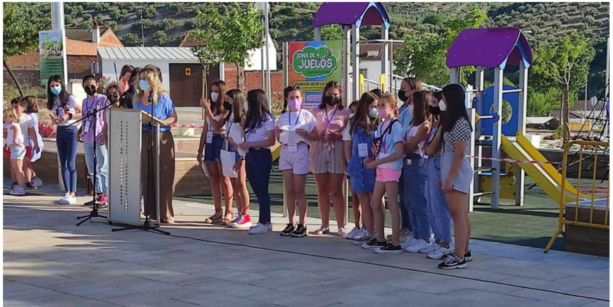
Inauguración parque Infantil Ciudad de Terrasa

un mayor número de población pueda beneficiarse. Además, las A.M.P.A.S. reciben subvenciones desde diferentes delegaciones para trabajar tanto con alumnado, como con familias. Destacan entre ellas las subvenciones del Área de Igualdad y del Área de Educación, para trabajar materias como la coeducación y el absentismo, realizando, por ejemplo, talleres de prevención del mismo, así como otros talleres psicoeducativos.