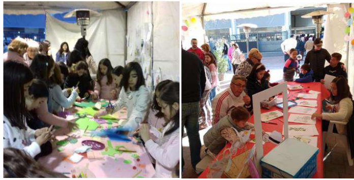
TALLERES DE MANUALIDADES EN OLEOCARTEYA 2019.

9.- Seguridad y educación vial (Desarrollada por la Concejalías de Seguridad y Deportes y Educación, con la colaboración de la Policía Local, Protección Civil y Guardia Civil).