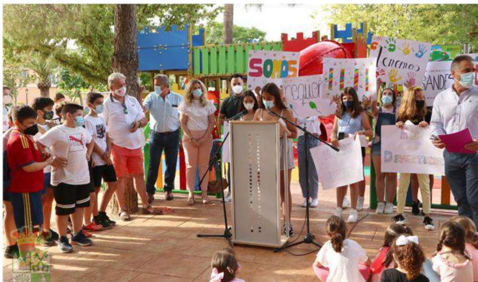
INAUGURACIÓN ZONA DE OCIO INFANTIL EN PARQUE PÚBLICO "PLÁCIDO FERNÁNDEZ VIAGAS". 2021.

13.- Infraestructuras para ocio y tiempo libre: la dotación de mobiliario e instalaciones de uso lúdico para los más pequeños, su renovación, mantenimiento y conservación, están siendo una política social de infancia muy presente en esta administración por lo que se realizará una evaluación constante de las mismas y se llevarán a cabo los proyectos de mejora que sean necesarios, como en los años anteriores.