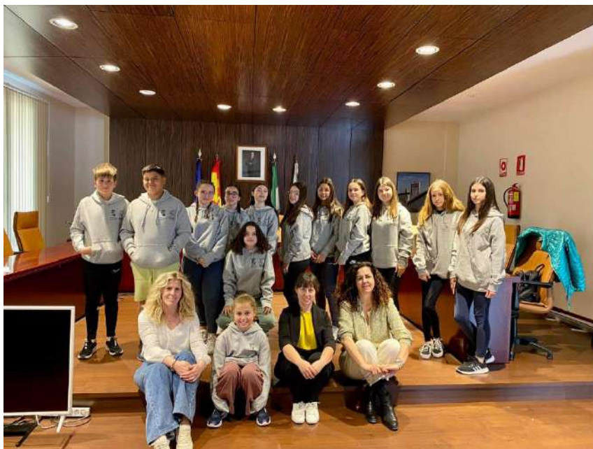
Reunión Concejo Municipal de Infancia y Adolescencia y Concejal de Bienestar

Como dato curioso es de relevante importancia: El león es una escultura realizada en piedra caliza. Su longitud es de 114,5cm. Data del siglo IV a.c.. Se encontró a 6 Km de Nueva Carteya y la Ermita de la Torre de los Santos. (Declarada de interés turístico cultural).