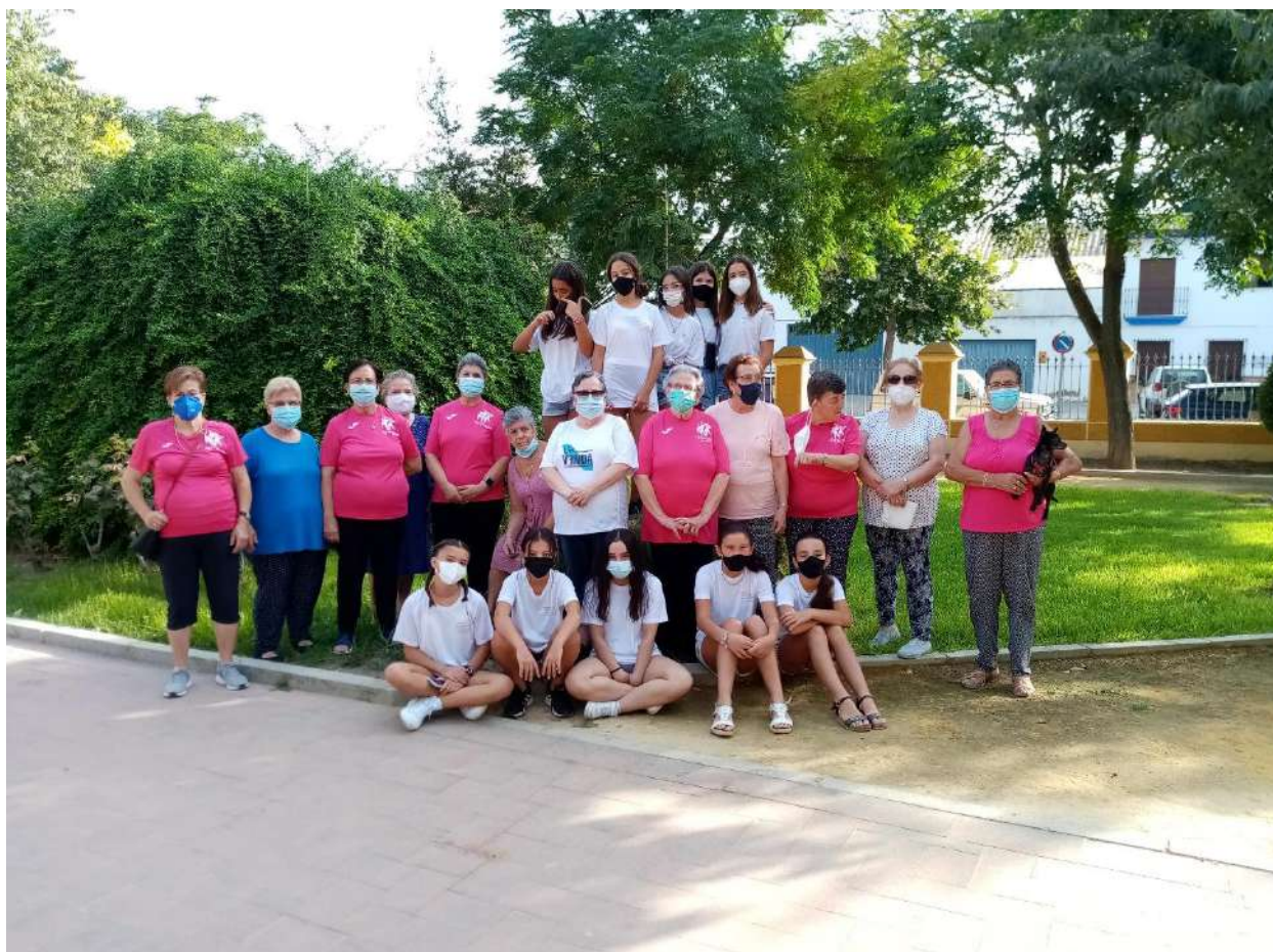
ENCUENTRO INTERGENERACIONAL 2021

Así mismo la ciudad cuenta con una amplia trayectoria de participación de Asociaciones de Padres y Madres en los Centros Educativos y en otras actividades propuestas por las distintas áreas del Ayuntamiento. Hay que comentar y destacar al respecto que los precios de todas las actividades municipales son muy bajos, para que