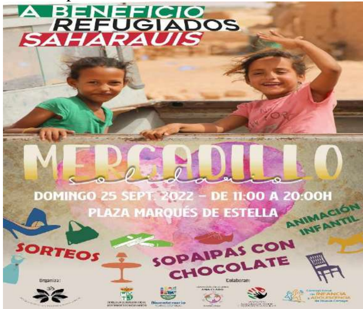
MERCADILLO SOLIDARIO. NUEVA CARTEYA. 25 DE SEPTIEMBRE DE 2022.

13.- Infraestructuras para ocio y tiempo libre: la dotación de mobiliario e instalaciones de uso lúdico para los más pequeños, su renovación, mantenimiento y conservación, están siendo una política social de infancia muy presente en esta administración por lo que se realizará una evaluación constante de las mismas y se llevarán a cabo los proyectos de mejora que sean necesarios, como en los años anteriores.