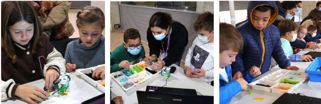
TALLER DE ROBÓTICA EDUCATIVA CON LEGO. DÍA MUNDIAL DE LA INFANCIA. 2021.

Nuestra intención es conseguir que siga creciendo como hasta ahora, tanto en número de miembros del mismo, como en su nivel de participación y opinión. Pensando especialmente en ellos se han llevado a cabo, dentro del Consejo o a nivel interno, actividades como talleres de teatro, talleres de danza y expresión corporal. Además, se quieren iniciar también nuevos talleres psicoeducativos para fomentar aspectos de salud, tanto física, como psíquica y emocional, que realizarán profesionales de la psicología.