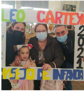
PHOTOCALL CREADO POR CONSEJO DE INFANCIA Y ADOLESCENCIA PARA OLEOCARTEYA 2021.