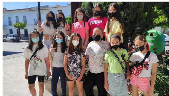
INAUGURACIÓN PARQUE "CIUDAD DE TERRASA". 2021.